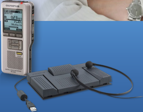
Digital Dictation & Transcription Kit Silver Pro